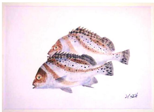
コショウダイ 元鱧 作